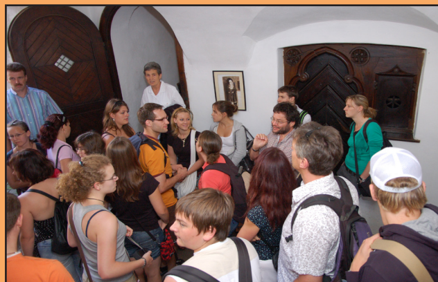
Das AJ-BW Sommer-Orchester 2008 in der Burg des Grafen Dracula

Erlebnisreiche Bildungsreisen mit viel Musik wurden in Südtirol, Polen, Kroatien, Sachsen, Ungarn (2x) und Holland und Rumänien durchgeführt.