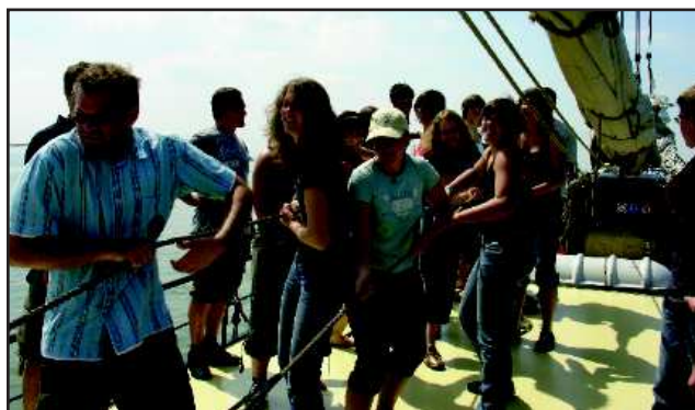
Das AJ-BW Sommer-Orchester 2007 beim Segeltörn auf dem Ijsselmeer